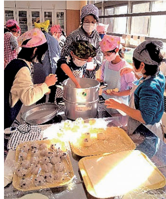
同支部の部員と協力して調理をする児童

女性部四賀支部は食育活動の一環として11月10日、松本市立四賀小学校で5年生の児童28人に、長野県の郷土菓子として知られている赤飯まんじゅうのつくり方を指導しました。使用したもち米は、同小学校の稲作学習で児童たちが収穫したものです。四賀支所では「支所協同活動」の取り組みとして、地域組織と協力しながら児童たちの稲作学習を支援しています。