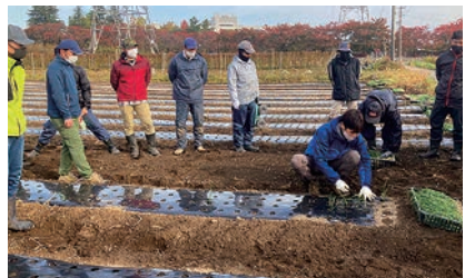
玉ねぎの植え方を確認しながら正しいに定植

青年部塩尻支部は、広丘地区のほ場で6月に開催予定のイベント「玉ねぎ収穫祭り」にむけて、玉ねぎの定植を行いました。収穫を体験することで、地域の人に農業の楽しさを知ってもらおうと昨年からはじめた取り組み。同部員や役員あわせて40人が参加し、16アールのほ場に、約3万株の玉ねぎを定植しました。昨年の生育状況を参考に、より品質の高い玉ねぎをめざし、土壌改良なども行いながら大切に育てていきます。