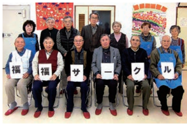
福福サークルのメンバー

女性部入山辺支部「福福サークル」はメンバー13人が、入山辺地域交流センターに集まり、コロナ禍での活動について話し合いを行いました。サークルの主な活動である料理教室は難しいものの、今だからこその話を話し、今後に向けて方向性を固めることができました。