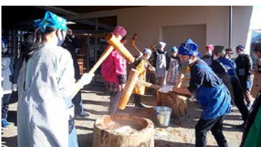
餅つきを行う小学生

5月の田植えから育ててきたもち米を使って、筑北小学校の5年生27人が12月10日、餅つきを行いました。「ヨイショ」の大きな掛け声とともに、杵でついたお餅はつやつやととてもおいしくできあがりました。田植えから脱穀、餅つきまで体験することで1年を通して、農業について理解を深めることができました。