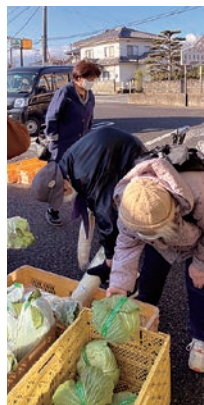
最後の買い物を楽しむ来店客

女性部塩尻支部と広丘支部の部員が採れたての野菜などを販売している「勇氣野菜館」が12月9日、今期最後の営業を行いました。最終営業日には来店客に感謝の気持ちを込めてシトラスリポンを渡しました。「今のうちに買いためしないと」「寂しくなるね」など惜しまれつつの最終日となりました。