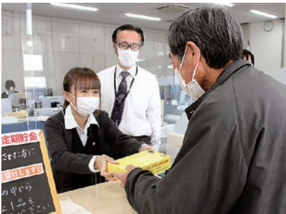
来店者に注意喚起のボックスティッシュを手渡すJA職員

今年も新鮮な農産物が楽しみ 広丘支所では12月15日、来店者に向けて特殊詐欺被害防止の呼びかけを行いました。近年、オレオレ詐欺や還付金詐欺といった高齢者の特殊詐欺被害が増えていることから、同支所の片丘地区、広丘地区の防犯協会と協力し、年金支給日にあわせて実施。支所の来店者にボックスティッシュを手渡ししながら、不審な電話や訪問に注意するよう呼びかけました。