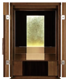
家具調仏壇 (上置きタイプ)