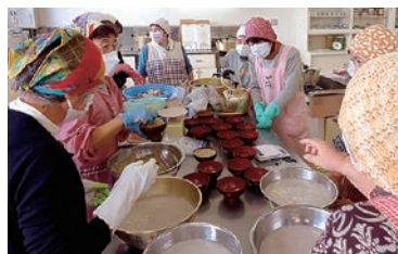
こんにやくづくりに挑戦

女性部島内支部と島内支所くらしの専門委員会は島内公民館で生芋を使ったこんにやくづくりを行いました。地産地消を目的に、支所協同活動で育てたこんにやく芋を使って実習。凝固剤を入れてからは、かき混ぜるのに苦労したものの、自分たちで調理したこんにやくはとておいしかったです。