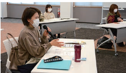
認知症について話しあう参加者

認知症サポーター養成講座を開催 見守り、安心の地域へ 若妻大学は1月12日、グリーンパルで「認知症サポーター養成講座」を開き、学生4人が参加しました。地域包括支援センターや社会福祉法人松本ハイランド「ゆめの里和田福祉相談センター」から講師を招き、認知症と共存し、希望を持って日常生活を過ごせる社会のありかたについて講義を受けました。講座の最後には、できる範囲で認知症患者やその家族を手助ける証として認知症サポーターカードを受け取りました。