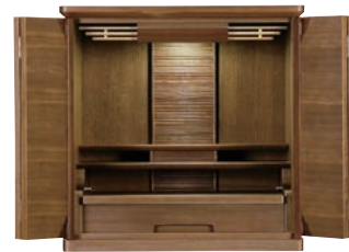
幅広家具調仏壇 (上置きタイプ)