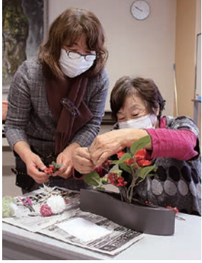
講師のアドバイスを受けながら制作する参加者(右)

女性部塩尻支部と広丘支部は部員同士の交流を深めつつ、明るい気持ちで新年を迎えてもらうと、フラワーアレンジメント教室を行いました。コロナ対策として5回に分けて分散開催。12月22日に塩尻支所で行われた教室には部員15人が参加。塩尻市のフラワーショップ「ティローズ」から講師を招き、椿をメインとし菊や南天などを使った華やかな、正月らしいアレンジメントづくりを行いました。