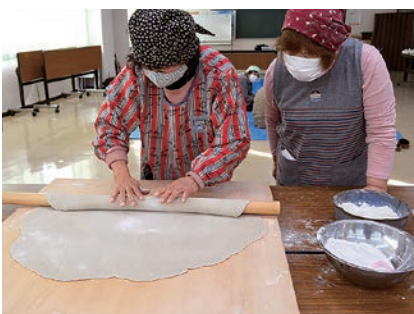
丹精込めてそば打ちに挑戦

女性部新村支部は、12月10日、そば打ち会を開き、部員26人が参加しました。同部員が育てているそばを使用し、本格的なそば打ちに挑戦。地産地消の取り組みの一環として活動を始め、30年以上つづく人気行事のひとつ。参加者は「1年に1度の講習で忘れていたことも多かったが、講師の方から手ほどきを受け、思ったより上手にできてうれしかった」と話しました。