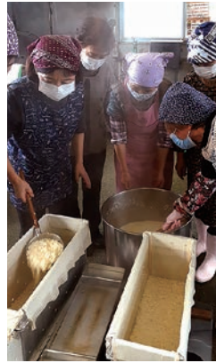
豆腐の加工を楽しむメンバー