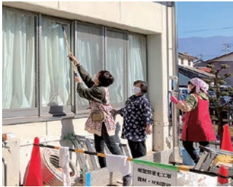
ていねいに作業をすすめた

女性部和田支部は地域貢献活動の二環として、社会福祉法人松本ハイランド「ゆめの里和田」の外回りの窓ふきを行いました。当日は役員8人が参加。コロナ禍のため、施設の中には入らずに外のみでしたが、利用されている方に気持ちよく過ごしてもらいたいと思いたいながら心を入れ込んで掃除を行いました。