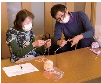
教えあいながらマフラーをつくる参加者

女性部島内支部「北方手芸の会」は島内北方公民館に会員8人が集まりました。手編みのマフラーづくりを行いました。寒い冬も、首回りをあたたくくすることで風邪をひかないようにと棒針編みに挑戦。編み始めは難しかったものの、教えあいながら取り組みことで楽しくつくることができました。