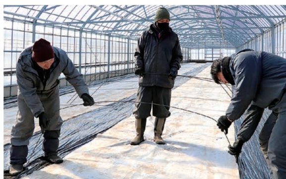
小ネギの育苗スタートに備えてハウスの準備をすすめる