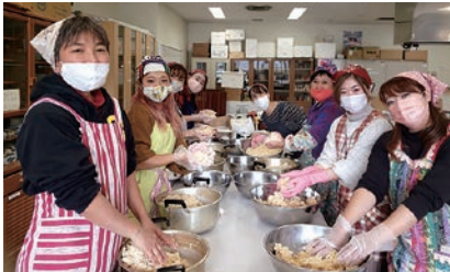
味噌づくりに励む参加者

女性部里山辺支部フレッシュミズグループ「めだかの学校」は味噌づくりを行いました。前日から豆を浸したり、漬したりと2日がかりの作業は、一人では大変ですが、集まってやることでとても楽しく行うことができました。仕込み終わる7カ月後が楽しみです。