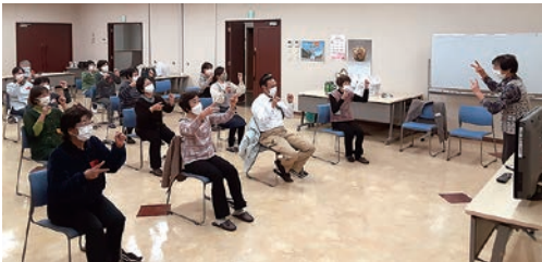
百歳体操を体験する参加者

女性部の島内・島立・新村・和田の4支部で11月17日、交流会を行いました。他支部の女性部員とも交流を深め、活動を知ることにより活発な女性部活動を行おうと実施。島内支部が毎週行っている「百歳体操」の体験やグループに分かれて、活動のようすなどを話しあい交流を深めました。参加者は「楽しく交流することができた。他の支部の活動を知ることが刺激になった」と話しました。