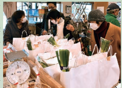
福袋を選ぶ買い物客

今年も同直売所では毎月7のつく日の「菜花の日」や偶数月の年金支給日に鹿妻支店での出張販売など、地元産農産物を積極的にPRし、消費拡大につなげていく考えです。