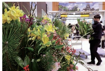
松本駅を彩るアレンジメント

JR松本駅に花きを展示 松本ハイランドとJA全農長野は12月28日、花きの販売促進にむけ、松本駅の改札口に松本ハイランド産「アルストロメリア」を使ったフラワーアレンジメント作品を設置しました。「松本ハイランドフラワー」の魅力を伝えるほか、家庭に花を飾るきっかけになればと展示。アルストロメリア450本を中心に、梅や松、赤い実の千両で正月を感じさせる華やかなデザインに仕上げました。