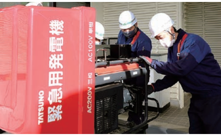
緊急用発電機を使った給油方法を確認するスタッフ

JAでは、事業継続計画(BCP)の優先事項のひとつとして、災害時のライフライン確保を基本方針に定め、災害時を想定した給油訓練を毎年行っています。1月12日には、今井スタンドと山形スタンドで災害時給油訓練を実施。管内12拠点からスタッフ16人が参加し、緊急用発電機や可搬式ポンプによる実践的な給油訓練を行い、災害時の体制と対応方法を確認しました。