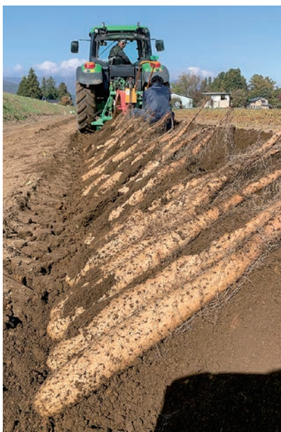
秋には立派なナガイモが収穫された

両親や弟、海外からの技能実習生など10人の従業員と農繁期には15人のパートで構成する(株)あわたつファームで小ネギ5ヘクタール、ナガイモ1ヘクタールなどを栽培。コロナ禍以前は気の知れた仲間と早起き野球をするのがリフレッシュ方法。「早起き野球が中止になり、最近はなかなかリフレッシュできていないから、コロナ収束後には、家族で旅行にいきたいね」と期待を込める。