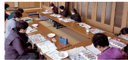
真剣な表情でSDGsの勉強を行う

女性部島内支部北方手芸の会は10月28日、メンバー10人が参加し、17色のビーズプレスレットづくりを行いました。SDGsとは何かを学んではからプレスレットをつくることで、SDGsについて、より理解を深めることができました。