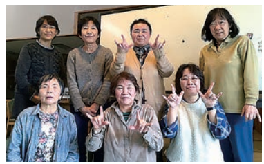
手話を通して交流を深める

毎週水曜日、明科総合福祉センターで、明科手芸サークルの会員12人が集まり、手話の学習を行っています。障がい者の生活や気持ちを理解することで交流を深め、仲間づくりを目的に活動。人とのつながりを大切に、手話を通じたコミュニケーションをこれからも深めていきます。