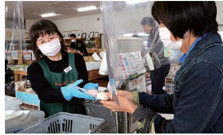
来店客に紅白もちを手渡す従業員

11月1日の松塩筑3JAの合併にあわせ、1日から3日の3日間、ファーマーズガーデン4店舗と畑の彩り館きろろ、新鮮市場ききようで合併記念誕生市を開催しました。仕込み味噌やエコープマーク品などを日替わりで特売したほか、初日には全店で先着200人に紅白もちを配布。新鮮市場ききようでは、開店と同時に多くの人が訪れ、にぎわいをみせました。