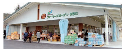
ファーマーズガーデンうちだ 〒399-0023 松本市内田792-7 ☎0263-88-3012