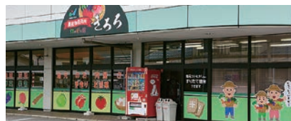
農産物直売所 畑の彩り館きろろ 〒390-1401 松本市波田10331-1 ☎0263-92-6003