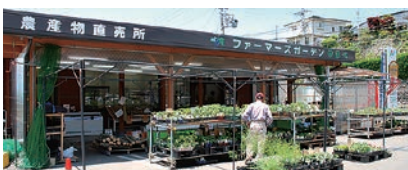
ファーマーズガーデンやまべ 〒390-0222 松本市入山辺1315-2 ☎0263-32-3644(山辺ワイナリー内)