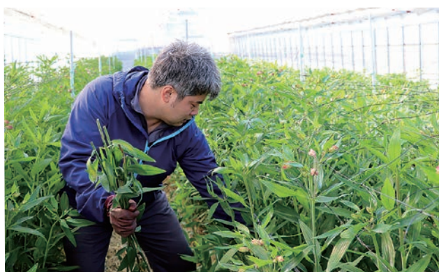
株元の整理を欠かさない