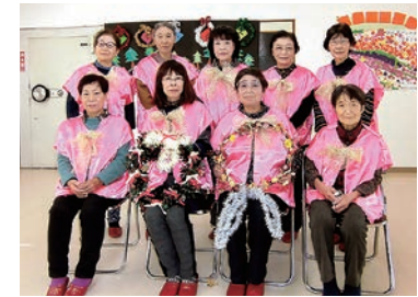
完成したクリスマスリースを手にとりこり

女性部入山辺支部陽だまりの会は11月10日、入山辺地域交流センターでクリスマスリースづくりを行いました。コロナの影響でうつくしの里の施設訪問ができなため、利用者の方々にも少しでもクリスマスのお囃子を楽しませようとして、今年初めて制作しました。