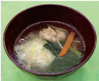
ナガイモの落とし汁