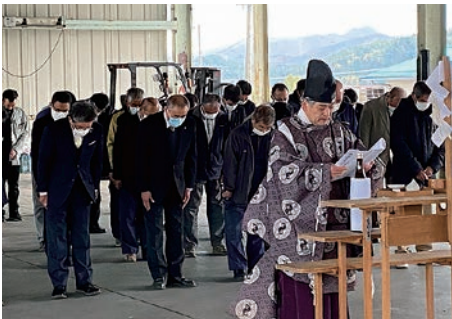
工事の安全を祈願する関係者

11月2日、朝日野菜予冷库集出荷施設で、工事の安全を願う神事「魂落とし」を行い、朝日支所野菜委員会の代表者など40人が出席しました。同施設は、経年劣化と作業の効率化にむけて更新工事を行い、来年4月末に竣工する計画。朝日地区のレタスやキャベツなどの葉野菜類の鮮度維持による産地ブランドの強化に活用します。