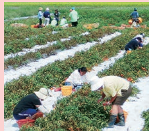
ジュース用トマトの収穫