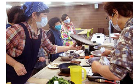
調理をおこなう参加者

女性部里山辺支部とくらしの専門委員は合同で、エークック調理器の商品研修を10月14日に山辺支所で行いました。コーストビーフや炊き込みごはんなど4品を講師が調理しながら実演。短時間で簡単にできいしくつくれる方法を学びました。