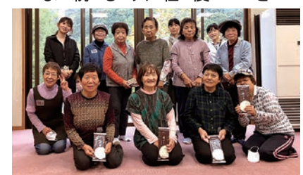
職員も参加して部員と交流を楽しんだ

女性部川手支部は10月8日、川手ライオンセンターの施設見学を行い、部員12人が参加しました。普段見られない施設に部員も興味津々なようすで、職員の説明を熱心に傾聴。施設見学の後はやまなみ荘でニュースポーツを楽しみ、さらに親睦が深まりました。