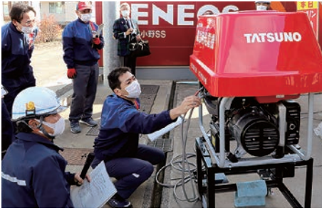
緊急用発電機の使い方を訓練するスタッフ

JAでは、事業継続計画(BCCP)の優先事項のひとつとして、災害時のライフライン確保を基本方針に定め、災害時を想定した給油訓練を毎年行っています。11月18日、北小野SSで災害時給油訓練を実施。管内の全スタンドからスタッフ17人が参加し、可搬式ポンプ、緊急用発電機を使用した給油訓練を行い、災害時の体制と対応方法を確認しました。