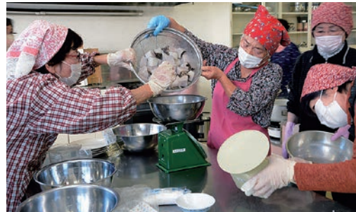
協力してこんにやくづくりをすすめる部員

女性部島内支部は11月10日と17日の2日間、生芋こんにやくづくり講習会を開催しました。10日に行った講習会には、部員18人が参加。協力して調理をすすめる50キロのこんにやくを手づくりしました。分量やゆで時間など、試行錯誤を重ねた結果、納得のいく仕上がりとなり、いまでは、同支部で人気の活動のひとつになっています。