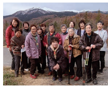
大自然の中で楽しむ

女性部本郷支部ノルディックウォーキング部は11月6日、部員15人が参加し、乗鞍高原休暇村でノルディックウォーキングを行いました。山頂付近では、雪景色を見ることができ、自然の空気をいっぱい吸って、健康的な一日を楽しみました。