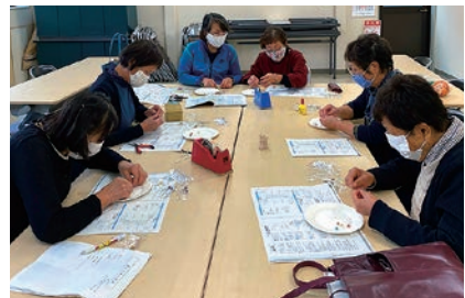
ビーズプレスレットづくりをすすめる部員

女性部筑北支部は10月8日、家の光に掲載されていた17色のビーズプレスレットづくりを行いました。部員6人が麻績支所に集まり実施。コードがなかなかビーズに通らず大変でしたが、部員同士で協力して完成させることができました。