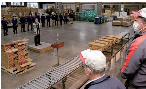
市場関係者に今年の出来栄をPRする横内副組合長