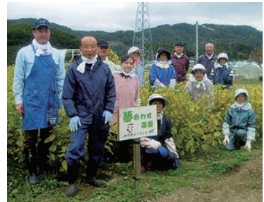
エゴマの収穫に汗を流した

10月15日、聖南支所の夢あわせ農園でエゴマの収穫作業を行い、地域の方々15人が参加しました。5月に植えた苗が立派に育ち、たくさんのエゴマを収穫。今後、ハウスで乾燥させ、油を搾り、精油になるのを楽しみ、和気あいあいと作業をすすめていきます。