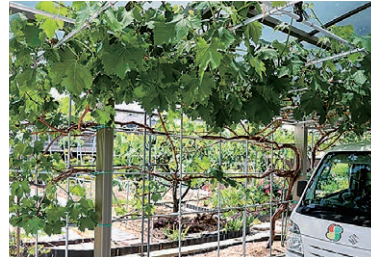
工夫して手作りしたぶどう棚

■広報誌「夢あわせ」2026年6月号11ページ「マイホビー」の記載に誤りがございました。正しくは以下の通りとなります。 誤)四賀・保福島町 正)四賀・保福寺町