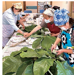
葉の汚れをふき取る参加者

女性部塩尻支部は5月29日、平出公民館で毎年恒例の朴葉巻き作りを行い、11人が参加しました。メンバーが持ち寄った朴の葉を使い、分担して1時間半ほどで仕上げました。参加者は「この季節しか味わえないので毎年楽しみ。年々手際が良くなり作業時間が短くなつた」とうれしそうに話しました。