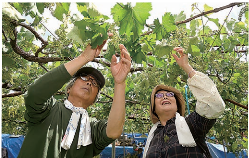
房づくりを行う参加者

生坂支所は、支所協同活動の二環として、体験型農場夢あわせ農園の「山清路@ぶどうファンクラブ」を運営しています。この活動は会員が栽培から収穫までを実際に体験してもらい「山清路@ぶどう」の魅力を伝え農業への理解を深めてもらうことが目的です。6月6日には5組17人の会員が種あり巨峰の房づくりを体験しました。