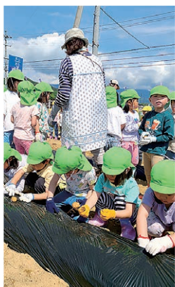
種芋を植える園児たち

5月12日、支所協同活動の一環として農家組合長が中心となり山形保育園の年長園児にじゃがいもの定植を教えました。マルチの穴に種芋を植え、参加した5歳の年長園児は「土がさらさらして掘るのがおもしろかった。大きくなるのが楽しみ」と話しました。