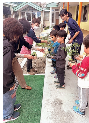
野菜苗を受け取る園児たち

女性部波田支部は5月8日、管内4園の保育園へ自給率向上と子どもたちの食育を目的に、プチトマトやかぼちゃの苗、枝豆の種を配布しました。9人の部員が参加し、受け取った園児たちからは「大きく育つのが楽しみ」と喜びの声があがりました。