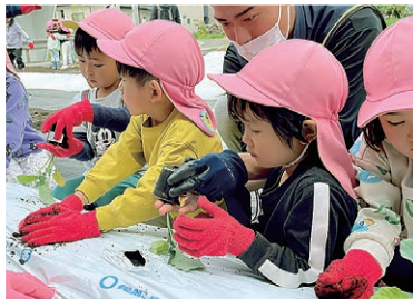
苗を植える園児たち