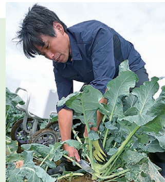
ブロッコリーの収穫に汗を流す