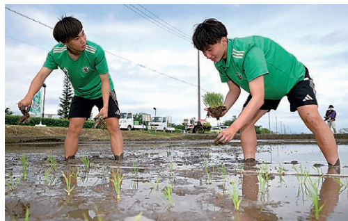
田植えをする選手たち

5月24日、神林地区の米生産者で組織する農事組合法人サウスが運営する「松本山雅田」で、松本山雅FC U-18の選手8人を招き、田植え体験を実施しました。同法人従業員の指導のもと、選手たちはコシヒカリの苗を手植えました。手植えの後には田植え機での作業も体験し、機械が素早く苗を植えていく様子に歓声が上がりました。