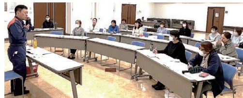
熱心に学ぶ参加者

女性部今井支部は5月12日、今井支所会議室で、松本広域消防局の職員を講師に迎え救急講習会を開催し、16人が参加しました。農作業中のケガや熱中症への対処法を学び、参加者は「これからの時期に注意すべき身近なことが学べて良かった」と話しました。