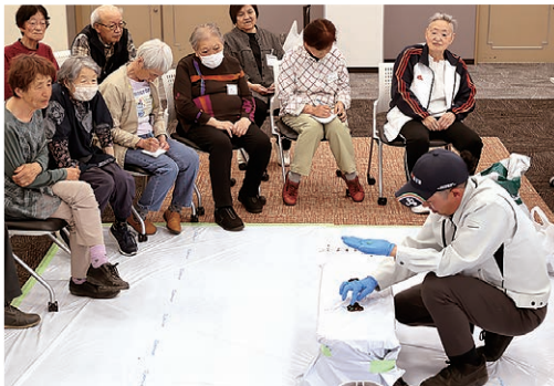
講義を受ける参加者

はつらつ大学は5月13日、令和8年度の開講式をグリーンパルで開催。今年度は29人が受講し、全10回の講座を予定しています。開講式後は第1回目の講義として「家庭菜園く夏野菜の植え方・育て方」を勉強しました。参加者は「座学だけでなく、実際の植え方を見られたことで理解が深まった」と話しました。