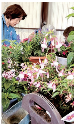
華やかな寄せ植えに挑戦

女性部本郷支部は5月12日、女鳥羽支所で春の寄せ植え講習会を開催し、20人が参加しました。営農指導員から野菜や花、ハーブを組み合わせたコンパニオンプランツの組み合わせを学びました。参加者は「珍しい花や色が多く、組み合わせを試すのが楽しみ」と話しました。