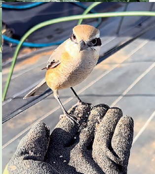
農作業に寄ってくるモズ

岡山県出身。夫婦2人でネギ40a、ブロッコリー20a、トウモロコシ20aを栽培。休日は夫婦で近所の公園などを散策し、イカルやコゲラ、オオルリなどの野鳥や季節の花々に触れてリフレッシュしている。