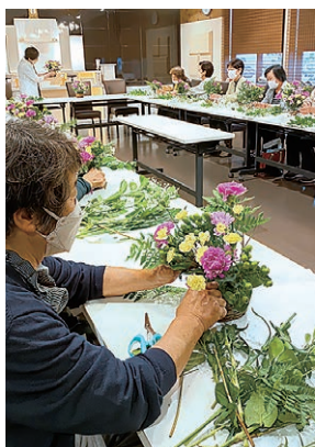
花をまとめる参加者

女性部筑北支部は5月21日、虹のホール筑北別館で班長全体研修会を開催し、18人が参加しました。「いざという時のために、知っておくとあんしんをテーマに、前半は葬儀や年金などの研修、後半はフラワーアレンジメント講習会を行いました。」