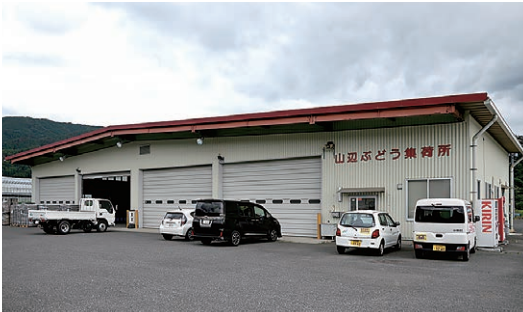
山辺地区特産のぶどうが集まる「山辺ぶどう集荷所」

農業・肥料・資材のことなら、ぜひわたしたちにお任せください。課長を筆頭に、職員が力を合わせ、地域の農業を支えるため日々奮闘しています。畑での病害虫対策や施肥の相談、資材選びのお手伝いはもちろん、どんなご相談にもていねいに対応します。畑の困りごとから急なご要望まで、スタッフ一同全力で、みなさまの農業経営をサポートしてまいります。