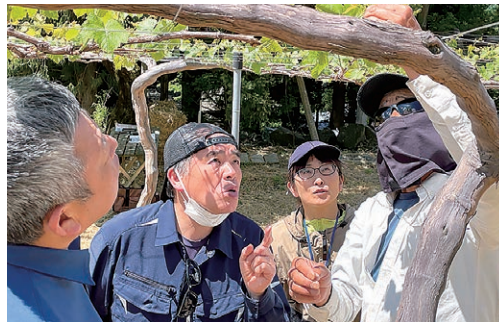
指導を受ける参加者

山辺地区で5月9日、新規就農希望者むけの2026山辺ぶどう体験会が初開催されました。山辺果樹部会が主催し、年間12回の実習を通じて産地の魅力を伝え、後継者確保を目指しています。参加者は「相談会などに参加しても実際の農作業を経験したことが無かった。この機会を活かして将来を考えたい」と期待を寄せました。