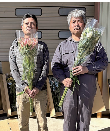
高品質な花を届ける

花き部会共選部アルストロメリア専門部は3月11日、アルストロメリア春期出荷目揃会を開催し、19人が参加しました。販売情勢の共有や出荷規格の再確認を行い、品質をそろえるためのポイントをていねいに確認しました。さらに、今後予定しているほ場巡回や合同産地フェアでの販売応援体制についても意見交換を行いました。