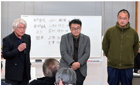
就任のあいさつをする新3役

花き部会は3月10日、グリーンパルで第34回通常総会を開催し、部会員やJA役職員ら39人が参加しました。酷暑の影響から栽培に苦労しましたが、販売面では母の日や盆彼岸の需要も高く高単価で推移しました。地元での消費宣伝にも力を入れ、公共施設でのフラワーアレンジメント展示を行いました。