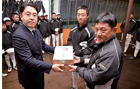
硬式試合球とエールを贈った

3月18日、「第32回J A共済杯日本リトルシニア全国選抜野球大会」に長野県代表として出場する「松本南シニア」を応援しようと、硬式試合球2ダースを贈りました。選手は「優勝をめざして日々練習に励み、がんばっています。ありがとうございます」と意気込みました。