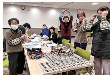
カラフルなアームカバー完成

女性部岡田支部は手芸教室を開催し、9人が参加。講師を招き、縫いでアームカバーと着物地を使ったエコバッグづくりに取り組みました。参加者は「手芸教室に何度も参加することで仲間意識が強くなり、信頼関係が深まった」完成したときは最高にうれしかった」と話しました。