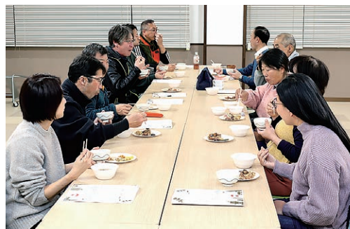
活発な意見交換が行われた

協同活動みらい塾のOBOGと中山寿支所の役員は2月17日、ふれあい館で第4回「戸田カフェ」を開催し、16人が参加しました。今回は米をテーマに、「一品を持ち寄って味いながら、みらい塾生の近況報告や情報交換、活躍の場づくり、支所協同活動について意見を交わしました。参加者は「今後も続けていきたい」と話しました。