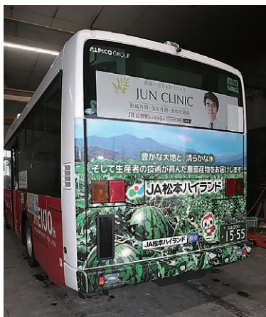
運行するラッピングバス

3月26日からアルピコ交通(株)と連携し、管内産農産物をデザインした路線バスの運行を開始しました。バス背面には幅約2メートル、高さ約1.5メートルの装飾を施し、管内ほ場の風景と当JA公式キャラクターゆめピーちゃんをあしらったデザインとなっています。このバスは1年間で管内の路線バスとして運行される予定です。