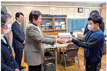
雑巾を受け取る児童(右)

女性部島立支部は、島立小学校へ60枚の雑巾を寄贈しました。新品のタオルを集め、1枚ずついねいに手縫いで仕上げたものです。受け取った児童は「大切に使用し、学校をきれいにしていきます」と話し、女性部員は「枚数は多くないけれど、みんなで作ってくださいます」と思いを伝えました。