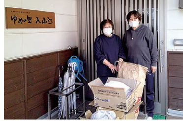
清拭布などを受け取る職員

女性部入山辺支部では福祉活動の一環として、ゆめの里と松風園へ清拭布と野菜の寄贈を行いました。清拭布は、家庭で未使用のタオルや布を使い準備し、野菜は部員の自宅で収穫したネギ、大根、ジャガイモなどを持ち寄りしました。集められた品物は、代表者が各施設へ届けました。