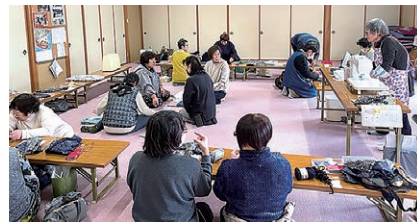
和気あいあいと楽しむ部員たち

女性部笹賀支部は、家の光掲載のシヨートアームカバーと毛糸の帽子の講習会を開催し、18人が参加。講師の指導を受けながら作品づくりに取り組み、和やかな雰囲気の中楽しんで味わいました。参加者は「編み物は久しぶりだったが、短時間で仕上げられた」と話しました。