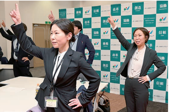
一致団結する渉外担当者ら

3月9日、グリーンパルでJ A松本ハイランドの令和8年度渉外担当者出発式を開催しました。役員および渉外担当者ら81人が出席し、金融・共済の相談活動を通じて組合員・利用者の暮らしに寄り添った活動に、全員が心を一つにして取り組むことを誓いました。