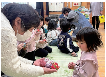
お手玉を渡す部員(左)

女性部笹賀支部は、昔ながらの遊びを地域の子もたちに伝えることを目的に、柏木保育園を訪問しました。部員が手づくりしたお手玉やあやとりを園児に手渡し、遊び方を教えながらいつしよに楽しみました。部員は「大人も夢中になって楽しかった」と話しました。