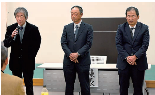
あいさつをする新役員

ぶどう部会は3月12日、グリーンパルで第34回通常総会を開催し、部会代議員やJA役職員ら46人が出席。昨年は高温の影響で成熟が早まったことを受け、目揃い会前から荷受体制を整備しました。また、生産者のためまめ努力により適熟での収穫・出荷を行いました。その結果、販売金額は19億1243万円となり、前年を大きく上回ったことを報告しました。