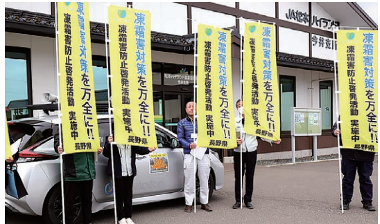
宣伝カーと参加者

3月16日、今井支所で松本農業農村支援センターによる「令和8年長野県凍霜害防止啓発キャラバン出発式」が行われました。冬の高温により果樹の生産前倒しが予想され、凍霜害の発生が懸念されることから、宣伝カーで会場へ注意喚起を実施。早期の対策準備を促し、被害の予防と軽減を図りました。