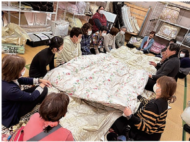
寝具の説明を受ける参加者

女性部波田支部は支部旅行を実施し、16人が参加しました。東洋綿業株式会社で寝具についての説明を受け、実際に触れながら気に入った寝具を購入した後、いちご狩りを楽しみました。参加者は「ゆつくり体を休めて、また仕事をがんばりたい」と話しました。