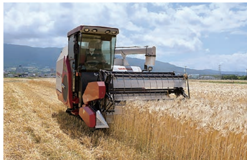
ホワイトファイバーを刈り取る

管内では例年より1週間ほど早い6月4日から、もち性大麦「ホワイトファイバー」の収穫を開始。今年は遅霜の凍害もなく春先の気温が高かったことから、背が高く穂も大きく生育し高品質に仕上がりました。管内では、200ヘクタールでホワイトファイバーを栽培しており、収穫総量は750トンを見込みます。