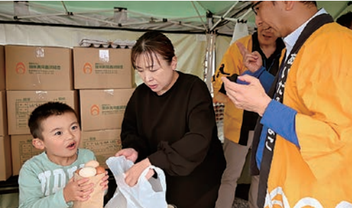
たまご詰め放題を楽しむ買い物客

養鶏部会は6月2日、会田共同養鶏組合と合同で「中信ファームフェス×たまごの駅10周年」を開催。イベントでは、地元農畜産物の販売、同養鶏組合によるたまごの詰め放題やたまごスープのふるまいなど、30のブースが出店。鶏とのふれあい体験やクイズラリーなど各種イベントにより学びを得られるよう工夫。当日はブースごと列をなし、にぎわいを見せました。