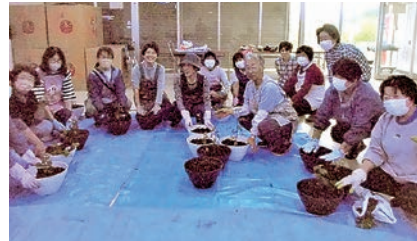
きれいな花が咲きますように

女性部中山支部は5月15日にドーム菊苗植え講習会を開催し、15人が参加しました。赤黄・白・ピンクの苗をそれぞれ植え、大きく育つようお願いを込めました。参加者は「秋にきれいなドーム菊になることを楽しみにしています」と笑顔で話しました。