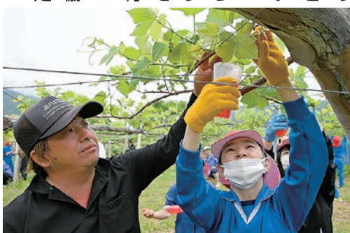
ジベレリン処理を指導

青年部山辺支部と山辺支所は、地元の子もたちの特産品のぶどうについて知ってもらおうと、本市立山辺小学校の6年生を対象にぶどう栽培を指導しています。5月21日には、種のないぶどうをつくるための「ジベレリン処理」の指導を行いました。生徒約100人が参加し、指導を受けながら協力してジベレリン処理を行いました。