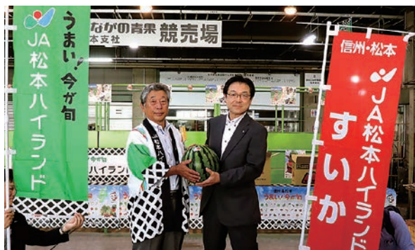
ハイランドすいかをPR