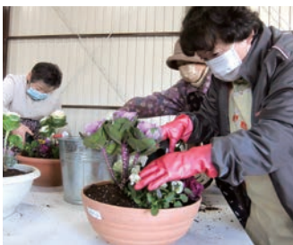
寄せ植えをたのしんだ

女性部本郷支部は5月27日、春の寄せ植え教室と営農講習会を女鳥羽支所で開催し、23人が参加。秋まで楽しめる花苗を寄せ植えたほか、野菜苗の育て方をJA指導員より学びました。参加者は「野菜について詳しく知ることができた。新しい野菜栽培にも挑戦してみたい」と意気込みました。