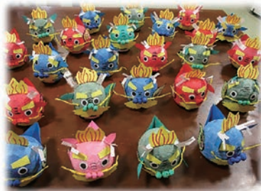
利用者のみなさんが作成した、「干支の置物」