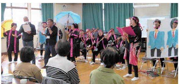
スコップの音色に酔いしれた

女性部塩尻支部の目的別グループ「JAB4080」は5月8日、塩尻市宗賀床尾区「かたくりの会」が主催する65歳以上の住民の交流会でスコップ三味線を演奏し、全9曲を発表しました。地域住民ら28人が参加し、手拍子を打ちながら演奏を楽しんだほか、体験コーナーで実際にスコップ三味線の演奏にチャレンジしました。