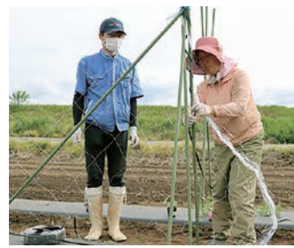
キュウリのネット張りを学んだ

女性部山形支部とくらしの専門委員会は5月15日、山形支所職員から家庭菜園で役立つ支柱の建てかたとネットの張りかたをほ場で学びました。参加者は「自己流になっていたのですが、確認できてよかったです。間引きや土の状態についても質問できたり、疑問が解消できた」と話しました。