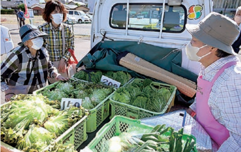
メンバーと会話しながら買い物を楽しんだ

女性部の有志が自分で育てた野菜や手づくりの加工品を軽トラックなどの荷台に積み込み、自ら販売する直売所「軽トラ市」が5月25日、グリーンパル駐車場で今年の営業をスタートしました。当日はオーブンを待ちわびた買い物客が開店と同時に訪れてにぎわいをみせました。今期は11月23日まで、毎週土曜日15時30分より開催を予定しています。