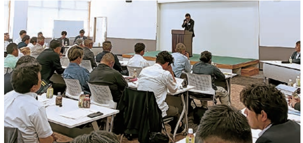
販売戦略を検討した

6月4日、グリーンパルで果実販売推進会議を開催し、市場関係者を招き、今後の販売戦略について検討しました。会議では2024年問題や燃料価格高騰による出荷コストの増加に対して生産者の手取り確保が急務であることや良質な果実を市場により多く流通させるために市場関係者と協力していくことなどを確認しました。