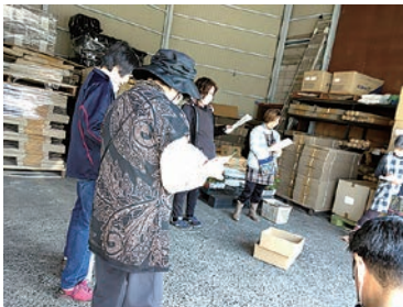
自給率向上をめざして

女性部筑北支部は5月10日、ちくほく農場ハウスで自給率向上運動の一環として野菜苗の配付を行い、8人が参加。ミニトマトや坊ちゃんかぼちゃ、枝豆を配付しました。参加者は「毎年ミニトマトがたたくさん、とれるので楽しみにしています」と話しました。