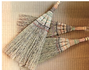
40年間守り続けたホウキモロコシ畑 穂を束ねる糸の色は特注しています