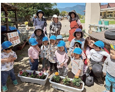
みんなに見守られて植えました

女性部和田支部は5月10日、和田保育園で園児と野菜苗の定植を行いました。野菜が成長していく過程を学んでもらおうと企画し、トマト、キュウリ、ササゲなどを協力して植えましました。園児たちは毎日の水やりを通じて食べ物ができる過程を学びます。