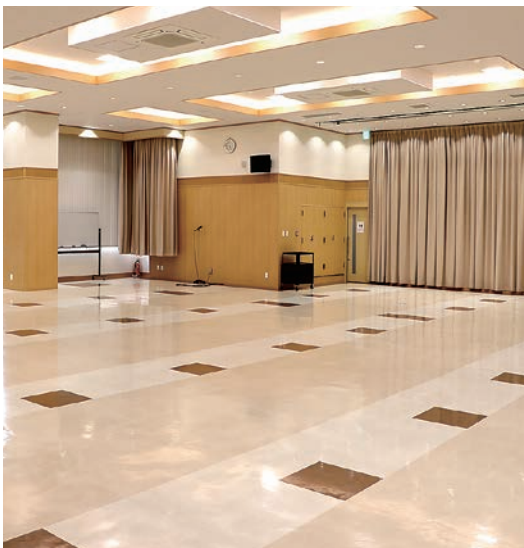
大会議室完備で大人数の会議にも対応可能

合併によりJA松本ハイランド松本支所として歩みだしてから3年8カ月が経ちます。金融共済課は松本駅前に、営農生活課は本所近くの出川に店舗を構えています。松本支所金融共済課では組合員・利用者のニーズに応えるべく相続対策と資産形成に力をいれております。相続・資産形成(NISA)に興味のある方はお気軽にご相談ください。