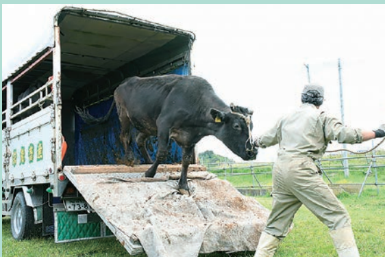
放牧地へ駆け出す牛

石巻市の市営河北上品山牧場で黒毛和牛の繁殖牛の放牧が始まっています。昨年は給水管の老朽化による修理のため中止しており、2年ぶりの放牧となりました。