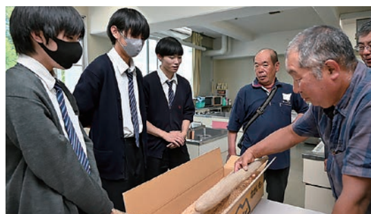
生産者からナガイモの説明を受ける生徒

根菜部会は5月24日、エクセラン高等学校美術彫刻・工芸専攻の生徒3人にナガイモの模刻作成を依頼しました。目揃会に役立てるため、出荷規格ごとに3つの模刻を作成します。完成した模刻は7月27日に開く文化祭で展示するほか、同JAのナガイモ目揃会や各種会議などで部会員にお披露目し、活用する予定です。