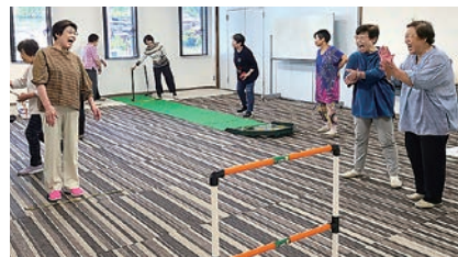
ニュースポーツを楽しんだ

女性部里山辺支部は5月24日、山辺支所でニュースポーツをしながら交流を深めました。部員ら15人が参加しラダーゲッターやスカットボール、輪投げ、羽根つこゲームなど4種類のニュースポーツに汗を流しました。その後は仕出し弁当を囲み楽しいひと時を過ごしました。