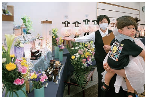
担当者の説明を熱心に聞く来場者

6月8日、グリーンパルでセレモニーフェアを開催し、19組33人が来場しました。お盆を前により多くの商品を見てもらうと開催。会場には盆提灯や霊前灯のほか、ギフト商品、法要料理などを展示し、来場者は説明を聞きながらじっくりと見比べました。また、相談コーナーを設置し、葬儀にまつわる相談なども受け付けました。