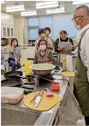
合同研修会で交流を深めた

女性部四賀支部は5月28日、くらしの専門委員会と合同商品研修会を開催し21人が参加しました。エコープ商品のナス漬の素を使い、作り方を学んだ後、時短できるエコープ調理器を使って焼き鳥、肉じゃが、山菜おこわを調理しました。