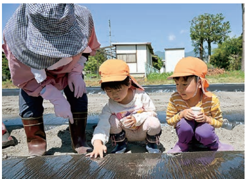
大きくなるよう願いを込めて

新村支所は支所協同活動の二環として6月11日、「ふれあい農園」で新村保育園の園児とともろこしの種まきとサツマイモの苗の定植を行いました。年中と年長の園児23人が、同支所北側の2.5アールの畑で、女性部員と青年部員、職員ら約20人の指導のもと、ていねいに作業を行いました。