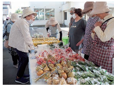
ひさしぶりに顔をあわせる地域住民と交流を深めた

女性部新村支部の直売所グループが運営する「新村女性部直売所」が6月14日、支所の敷地内で今年の営業を開始しました。地元産の野菜、花、米などを販売し、オープン記念に花苗をプレゼントしました。7月16日には、すいかの販売を予定しています。