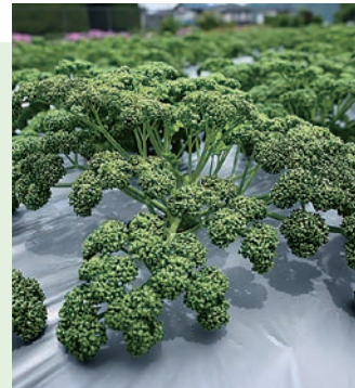
収穫をむかえる青々としたパセリ