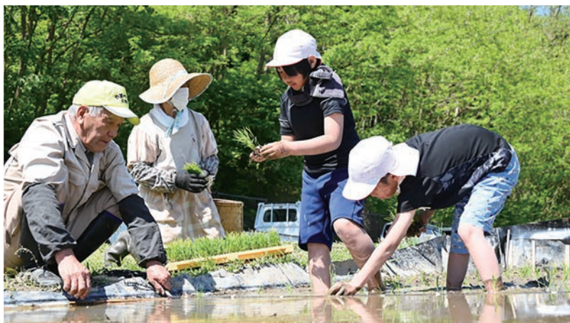
小学校の食育活動

青年部や女性部、支所協同活動などでは、小学校への食育活動を積極的に行っています。農産物の栽培や学校田の指導、児童の育てた大豆を使っての豆腐づくり出前講座など、次世代を担う子どもたちに向けた取り組みです。